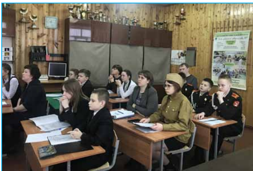
Муниципальная конференция «Первые шаги в науку», посвященная 75-летию Великой Победы.

4. Детство, опаленное войной. Сборник воспоминаний детей войны / сост. В.З. Соркин. – Вологда: ИНП «Фест», 2014.