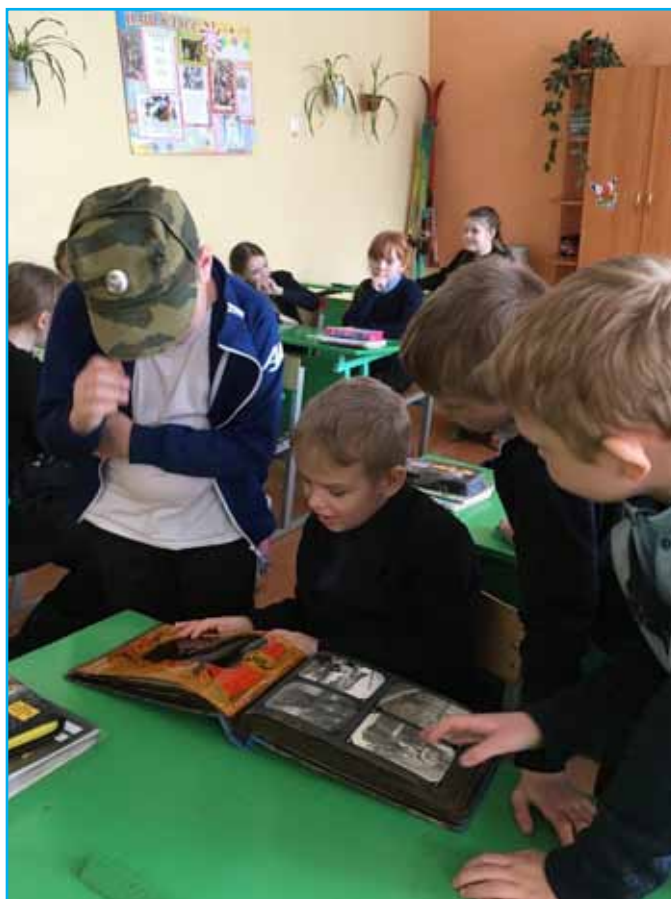
Урок мужества «Дети войны» в БОУ СМР «ООШ № 2».

Со стороны советского народа война 1941–1945 гг. имеет и другой образ, особые моральные характеристики. Это война великая (масштабность военных действий по территории, охвату населения;