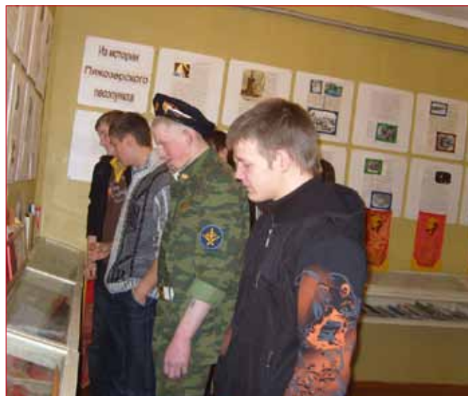
Встреча «Солдатами не рождаются». 11 класс