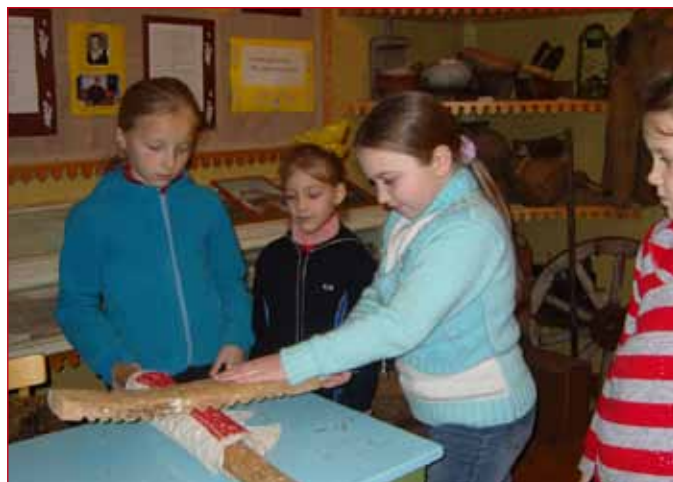
«Так жилали наши деды». 3–4 классы