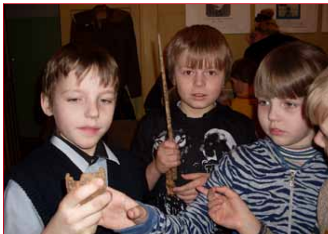
В музее третьеклассники. Урок «Они сражались за Родину»

Членами кружка собран богатейший материал о земляках, которые были живыми свидетелями событий Великой Отечественной войны. Ребята встречались с ветеранами, тружениками тыла, с узниками концлагерей, с теми, кто в годы войны были еще детьми. Они записывали их рассказы, сопоставляли с реальными событиями того времени, анализировали, до-